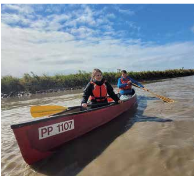
Pedal und Paddel tauschen: Auf dem Wasser erleben Feriengäste die Natur des südlichen Ostfrieslands aus ganz anderer Perspektive.

für die eigene Urlaubsplanung finden sich etwa unter www.suedliches-ostfriesland.de , hier lässt sich zudem das kostenlose Urlaubsmagazin 2026 anfordern.