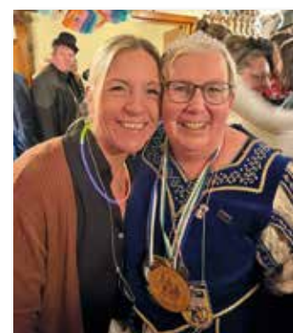
Königin und Prinzessin ...

ke Sieben zu ihrer Kneipentour durch Hoetmar. Ihr Elferrat, die IGF, hatte ihr einen alten Kofferwagen, der schon öfter im Karneval im Einsatz war, hergerichtet und zog die Prinzessin trotz eisiger Kälte am Samstag, dem 10. Januar, von Kneipe zu Kneipe durch Hoetmar! Gestartet wurde erstmals