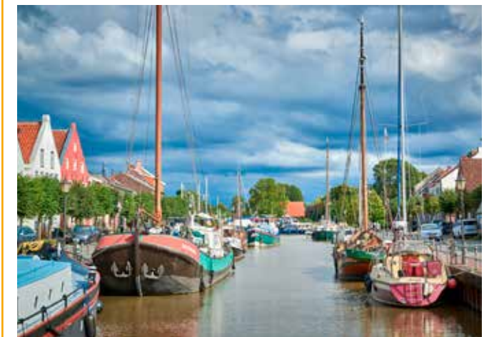
Neben gut ausgebauten Radwegenetzen locken auch gemütliche kleine Orte wie hier am alten Hafen von Weener zu Entdeckungstouren.

fühl. Auf einem sehr gut ausgebauten Netz von über 1.000 Kilometern Länge schlängeln sich die Wege durch Polderlandschaften und entlang der Deiche. Schafe halten dort das Gras kurz, während der Blick über das Unesco-Weltnaturerbe Wattenmeer schweift. So verbindet etwa die internationale Dollard Route das Rheiderland auf reizvolle Weise mit der niederländischen Provinz Groningen und führt vorbei an verwitterten Backsteinkirchen und prunkvollen Bauernhäusern. Wer es noch uriger mag, folgt der Deutschen Fehnroute entlang der alten Kanäle, den sogenannten Wielen. Wo früher mühsam Torf gestochen und mit Schiffen abtransportiert wurde, prägen heute weiße Brücken und historische Windmühlen das Bild. Viele weitere Einblicke und Inspirationen